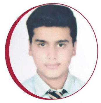
Somendra Singh B.Com. (Applied Economics) Career College