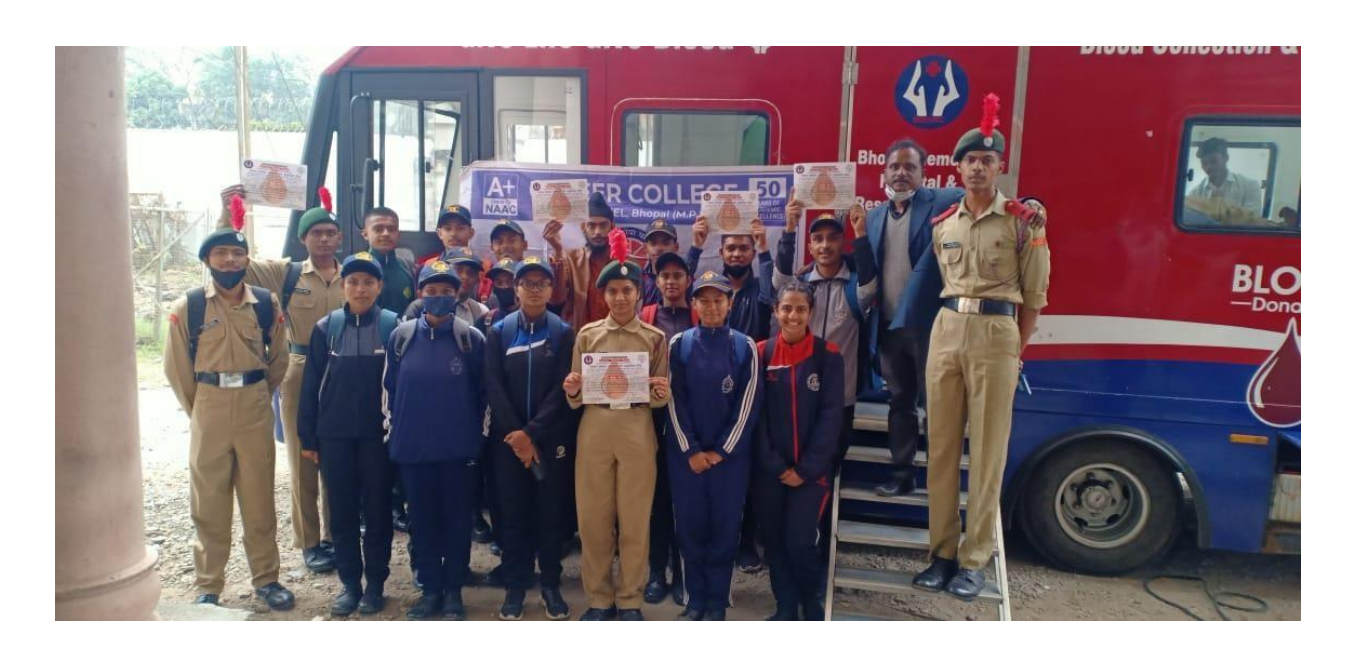
NCC organizes Blood Donation camp in Career College ,Bhopal.