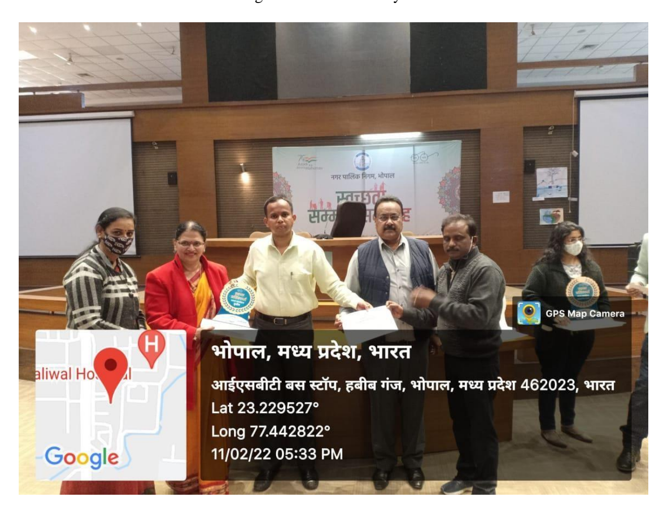
Career College won Sachata Abhiyan Prize 2022.